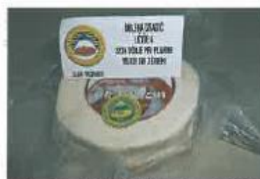
Dobrote šentjurskih pridelavcev so vse bolj prepoznavne doma in tudi v tujini. Stavijo na domače, lokalno, sveže, vrhunsko.

Povzeto po prispevku Vesne Mišalič, KGZ – Zavod CE