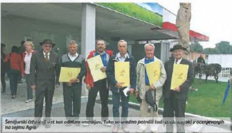
Šentjurski čebelarji vret kot odlično »medij«. Tako so uradno potrdili tudi strokovnjaki v ocenjevanjih na sejmu Agri.